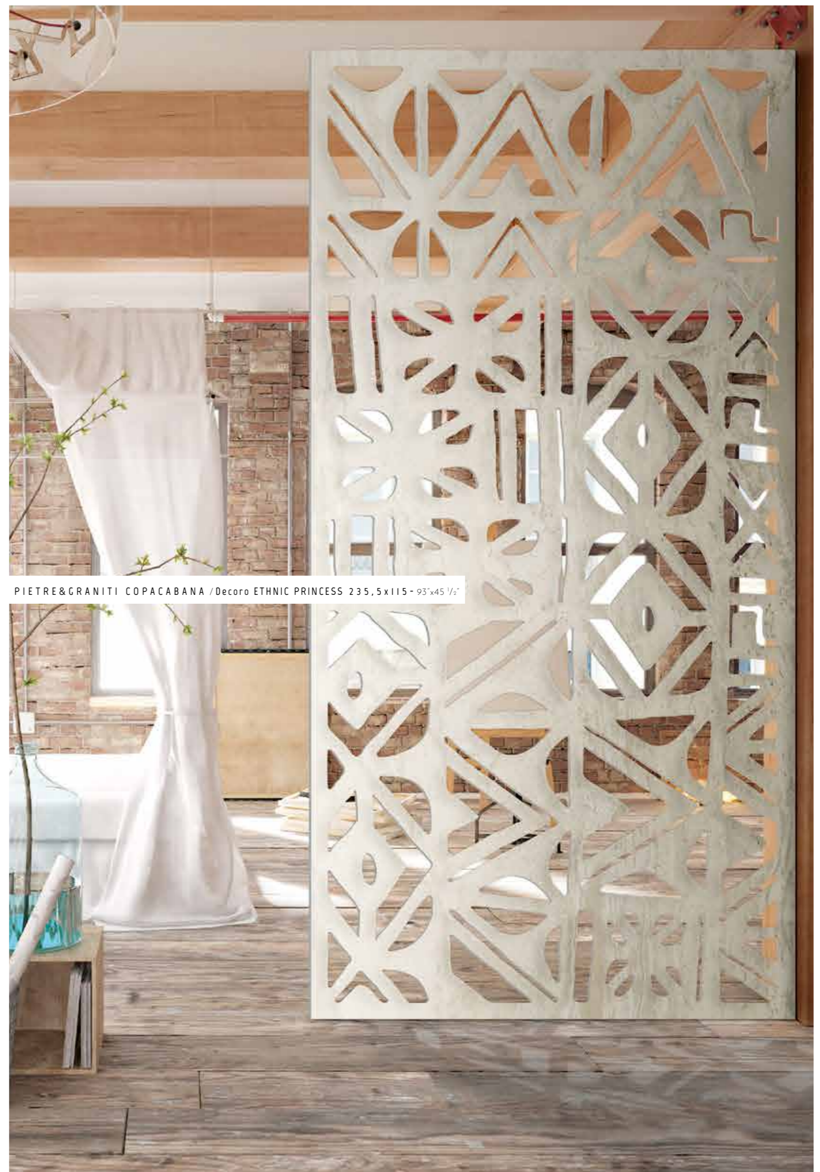
PIETRE & GRANITI COPACABANA / Decoro ETHNIC PRINCESS 235,5x115 - 93"x45 1/2"